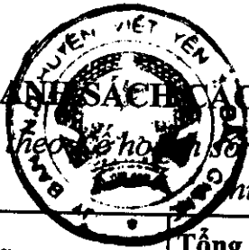
BIỂU 1: DANH SÁCH CÁC THÔN THỰC HIỆN DDĐT NĂM 2015 (Ban hành kèm theo Quyết định số 24/KH-UBND ngày 26/01/2015 của UBND Huyện Việt Yên)