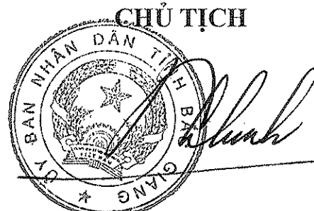
Nguyễn Văn Linh